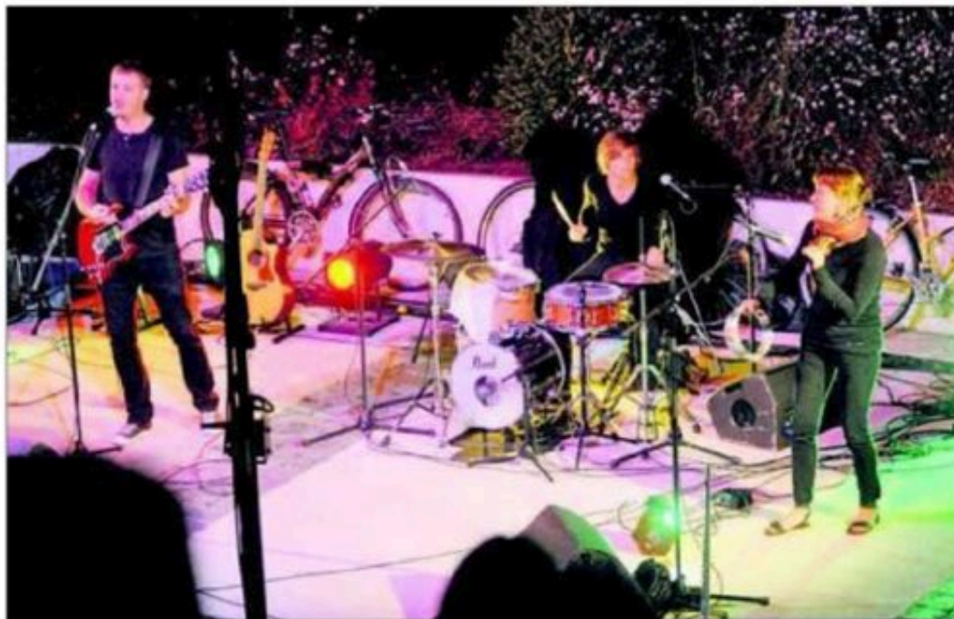
Les vélos posés contre la balustrade. Les Pieds s'entêtent a repris les chansons de Georges Brassens et présenté quelques compositions, vendredi dernier.