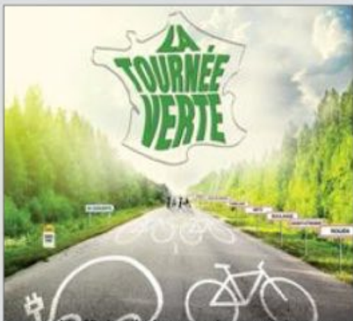
L'affiche de la tournée est claire...

Dans le cadre du festival Cabanes initié par le conseil général, la tournée des Pieds s'entêtent passera, cet été par le Pays-Haut.