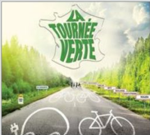
L'affiche de la tournée est claire...

Dans le cadre du festival Cabanes initié par le conseil général, la tournée des Pieds s'entêtent passera, cet été par le Pays-Haut.