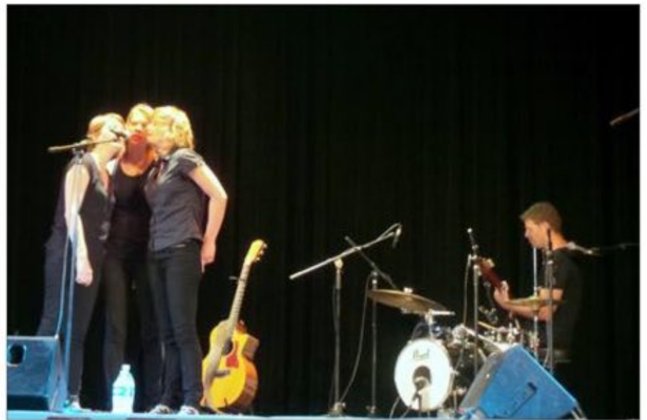
La tournée verte des Pieds s'entêtent est passée par Aumetz, Boulange, Audun-le-Tiche et Villerupt.

La tournée verte a déjà rassemblé plus de 2 000 spectateurs en août 2013. C'est un projet durable, culturel, citoyen et innovant qui veut bousculer les habitudes en démontrant, simplement par l'exemple, qu'on peut se déplacer sans polluer. Il est également sans compromis. Les Pieds s'entêtent effectuent leurs représentations dans les mêmes conditions que les 200 concerts qu'ils ont don-