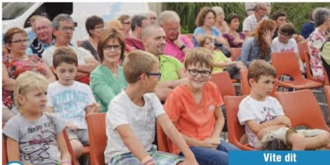
Les habitants et vacanciers au rendez-vous ont profité du concert en plein air.