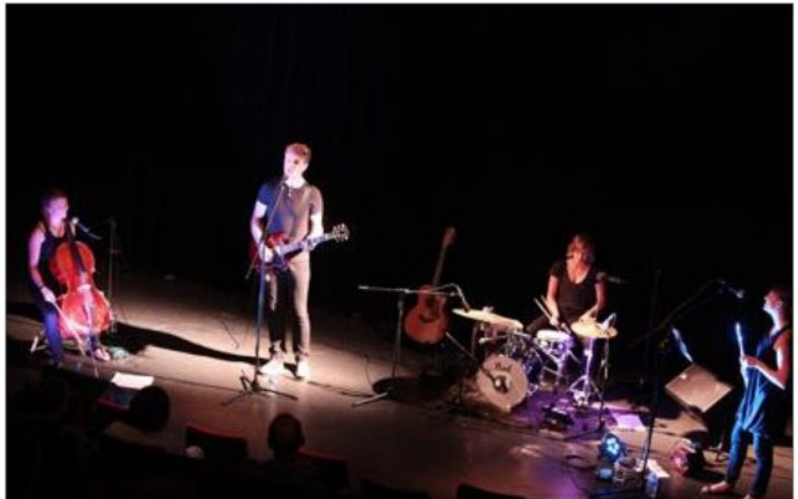
Les reprises des chansons de Georges Brassens ont été de véritables perles auditives.