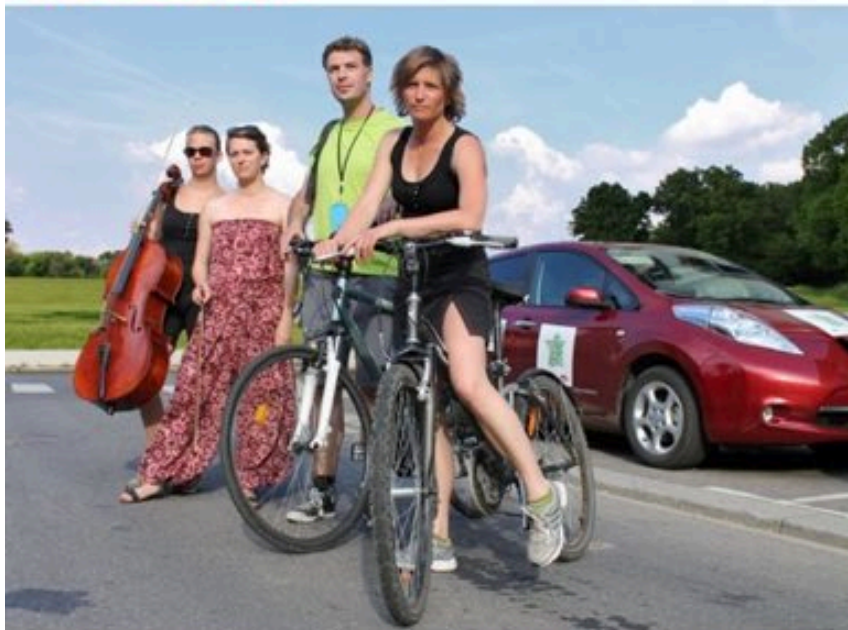
Les acteurs musiciens de la tournée verte.