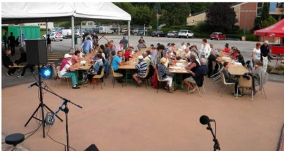
Une partie des spectateurs dîneurs

Dans le cadre de la Tournée verte, l'OMAC et le Syndicat d'initiative de Pont-du-Casse organisaient un repas spectacle le mardi 19 août esplanade du centre culturel. Les chanteurs et musiciens font le tour de l'Hexagone à bord de véhicules électriques, alliant tournée à écologie avec beaucoup de succès. C'était leur seule date dans le département et Pont-du-Casse a été très fier de les accueillir. 250 personnes ont ainsi profité d'un excellent repas avant de découvrir le groupe