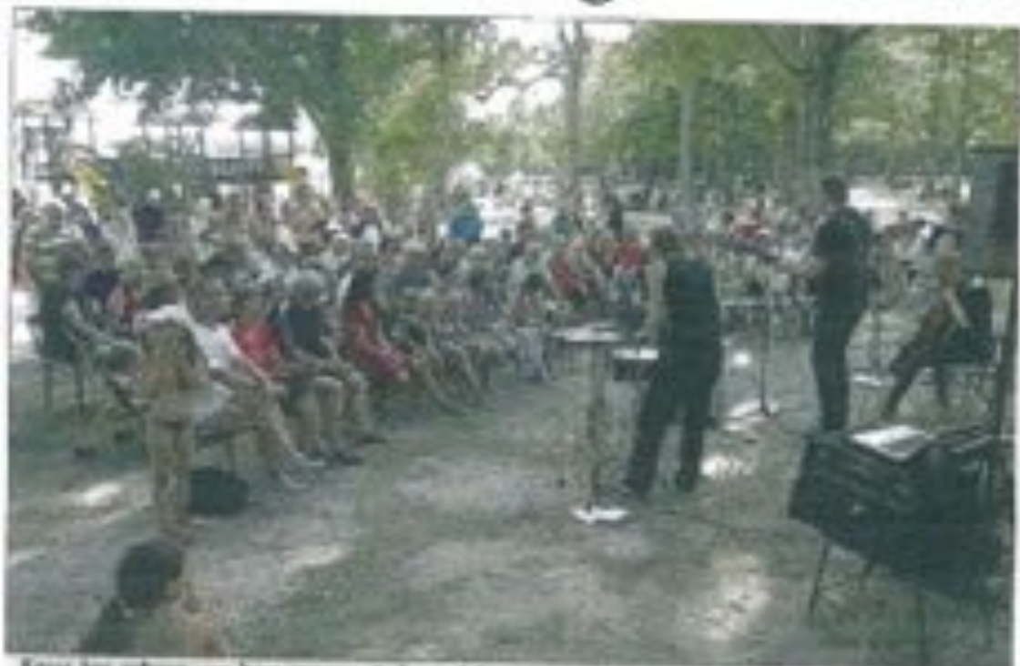
Sous les arbres, un bon moment de poésie.

Les amateurs murmuraient les paroles et les applaudissements nourris soulignaient chaque chanson. Pendant plus d'une