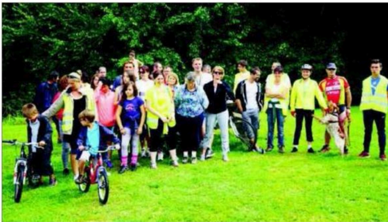
Les Régalades et la Tournée verte ont partagé un pique-nique et pris part à une rando VTT.

Jeudi, les Régalades, une balade organisée par la Communauté de communes de Haute Saintonge, ont accueilli la Tournée verte pour un parcours de 23 kilomètres séparant Chevanceaux de Cercoux, à couvrir à vélo.