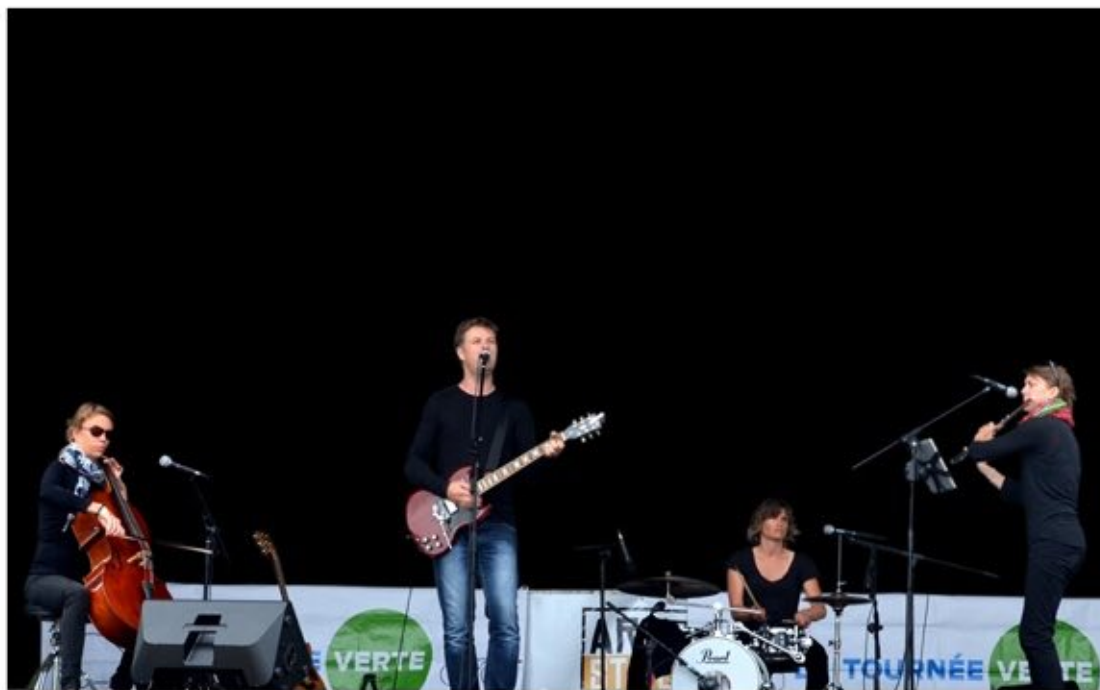
La tournée verte en concert.

Elle sillonnera près de 2 500 km à vélo, et en voiture électrique à travers 18 régions et présentera 40 concerts dans toute la France (10 000 spectateurs attendus). La première Tournée Verte d'envergure