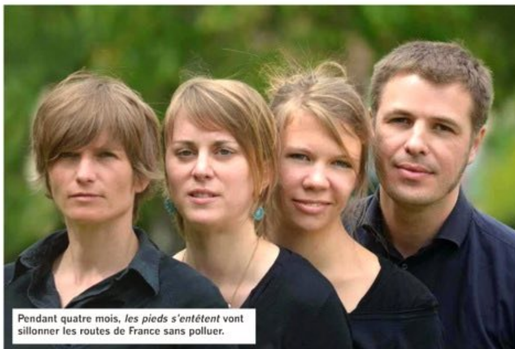
Pendant quatre mois, les pieds s'entêtent vont sillonner les routes de France sans polluer.

Cette idée qui peut paraître folle au départ, séduit. La première expérience s'est révélée prometteuse. « Dès septembre 2013, on s'est dit qu'on allait organiser quelque chose de plus important pour l'été 2014. Nous avons finalisé un partenariat avec Renault qui nous prête deux voitures électriques pour transporter le matériel sur toute la tournée ».