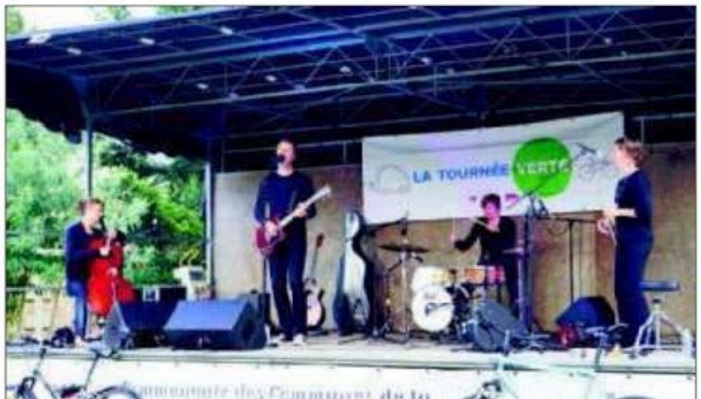
Les Pieds s'entêtent en concert.

Originaires de Rouen, ils en sont à leur troisième mois de tournée, qui a débuté le 31 mai à Saint-Étienne. Chaque soir, ils se produisent en spectacle après avoir parcouru 30 à 50 kilomètres à vélo. Afin de réduire l'impact carbone,