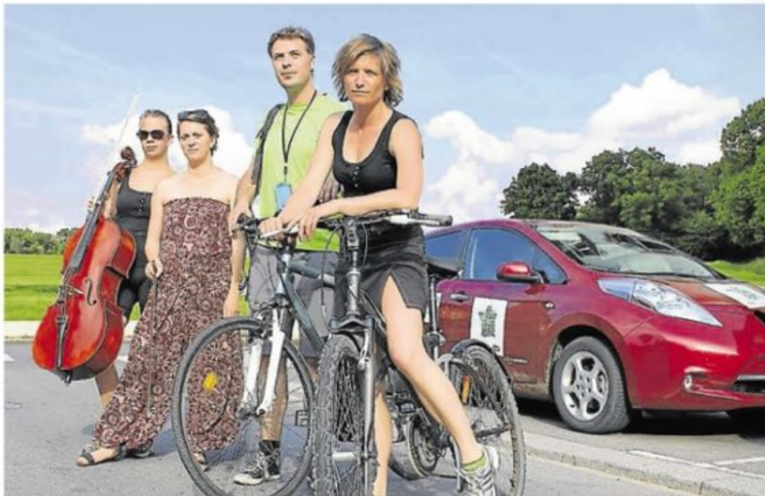
Le groupe Les Pieds s'Entêtent pédale tous les jours de ville en ville, au gré de leur tournée, pour produire moins de CO 2 .

Cette idée de tournée verte a commencé en 2013, le groupe a donné dix concerts, soit 600 km en 10 jours. Cette aventure leur a prouvé que c'était possible de faire une tournée autrement. « Même si les premiers jours ont été difficiles, car on n'était pas habitués à faire beaucoup de vélo, aujourd'hui je suis plus en forme qu'avant. On a presque tout les jours un concert. Grâce au vélo on est beaucoup mieux préparés, on est en forme grâce au sport. Alors, quand on ne fait que de la voiture, on est crevés moralement. Tout le monde est motivé. On va maintenant faire chaque année notre tournée à vélo. On souhaite promouvoir le vélo comme moyen de transport, pas comme un sport du dimanche mais pour l'utiliser tous les jours ». Organiser cette tournée verte n'a pas été simple, il a fallu une année d'organisation. Trouver des partenaires : Nissan pour la voiture électrique, et la SNCF pour les billets de