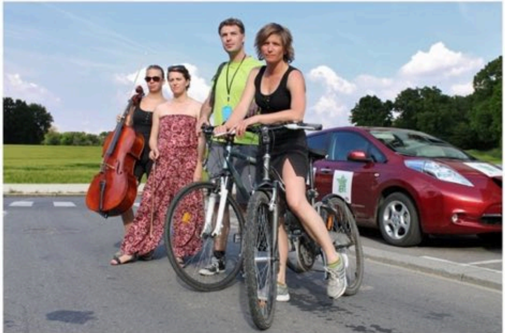
Les Pieds s'entêtent avalent les kilomètres à vélo et en voiture électrique.

bien roulé. Si bien que le groupe a remis le couvert cette année. De façon plus ambitieuse.