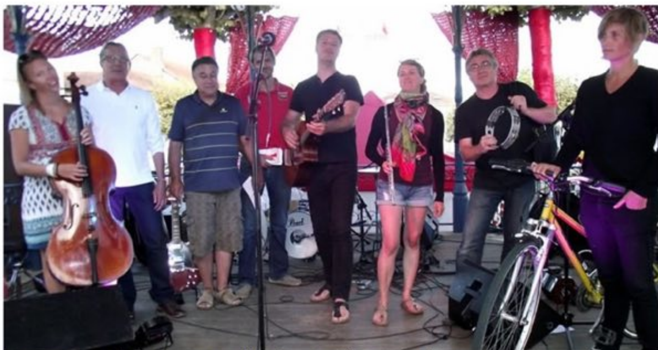
Le groupe « Les Pieds s'entêtent » accueilli par le maire et l'Association de commerçants.

L e quatrième et dernier marché de nuit Vic a attiré de nombreux visiteurs venus profiter des affaires à la fraîche et de l'ambiance musicale, notamment celle de la Tournée verte , venue à l'initiative de l'Association de commerçants et artisans et de la municipalité. Le maire avait reçu un mail du groupe écolo normand : « Leur façon de procéder, notamment une tournée musicale sans émission de CO 2 , m'a interpellé. J'en ai parlé à l'Association de commerçants, qui a été convaincue, sachant que la mairie participerait à la moitié du cachet. Vic-Fezensac est partenaire de ce