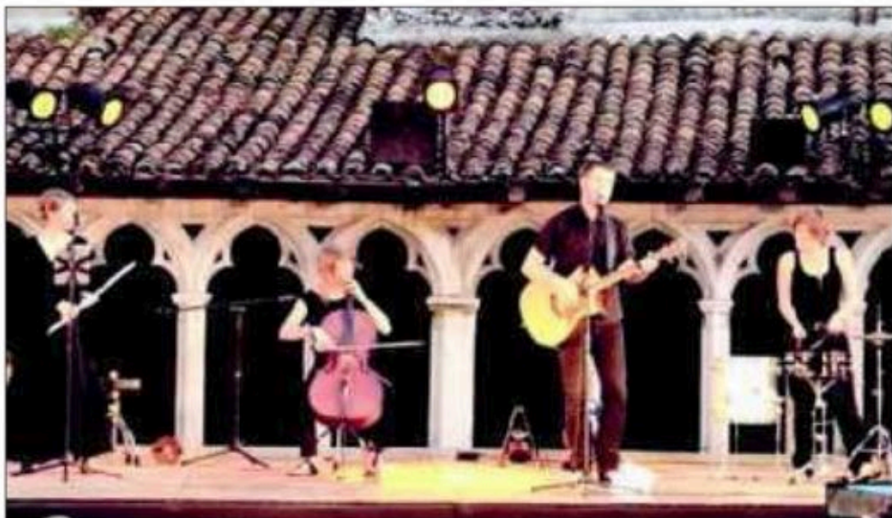
Les Pieds S'Entêtent.

Boissons et tapas à partir de 19 heures.