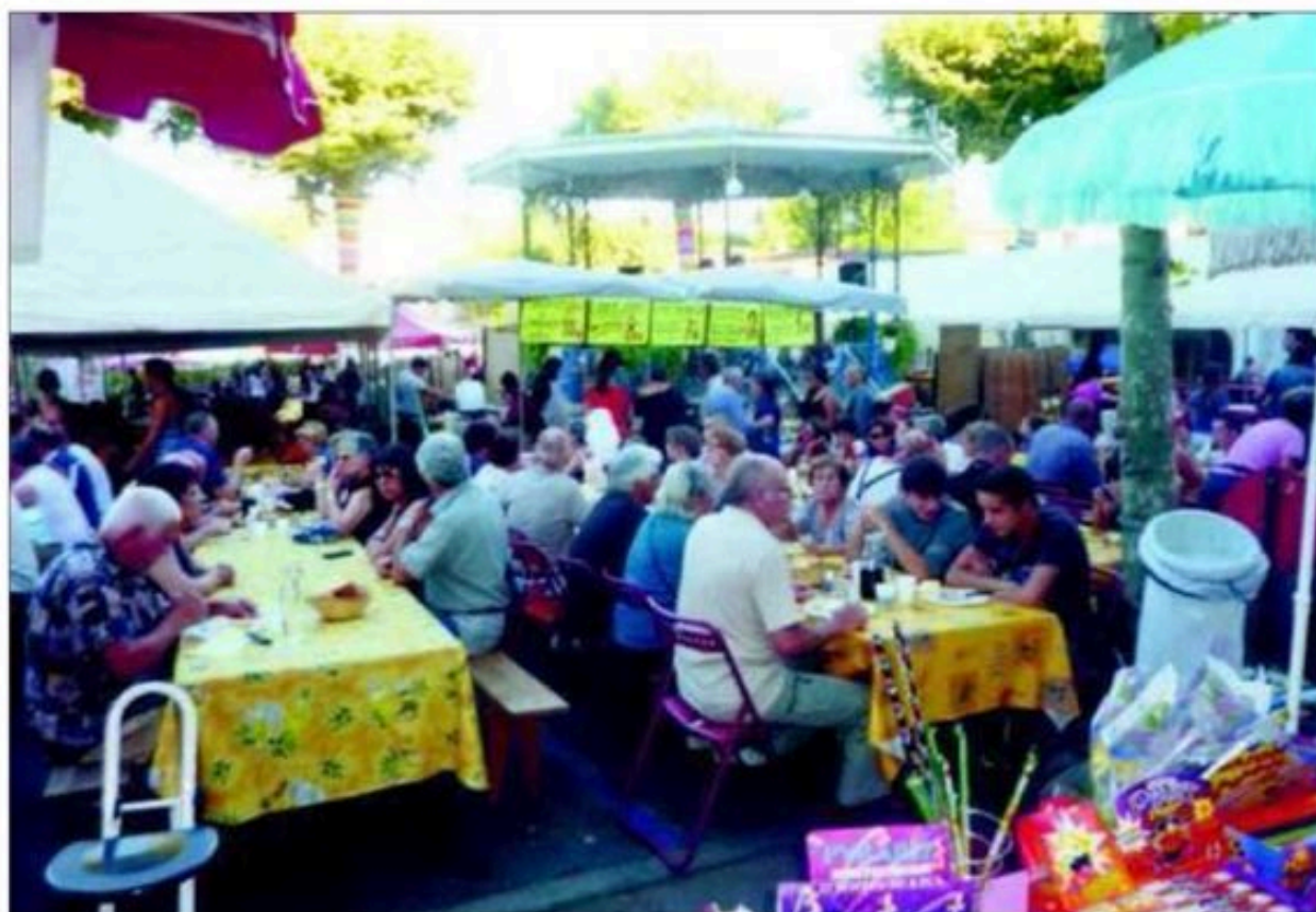
Le kiosque abritera ce soir le repas en plein air du dernier marché de nuit de l'été.

VIC-FEZENSAC Pour le dernier marché de nuit de l'été, ce soir, il y aura un repas autour du kiosque et le concert de la Tournée verte