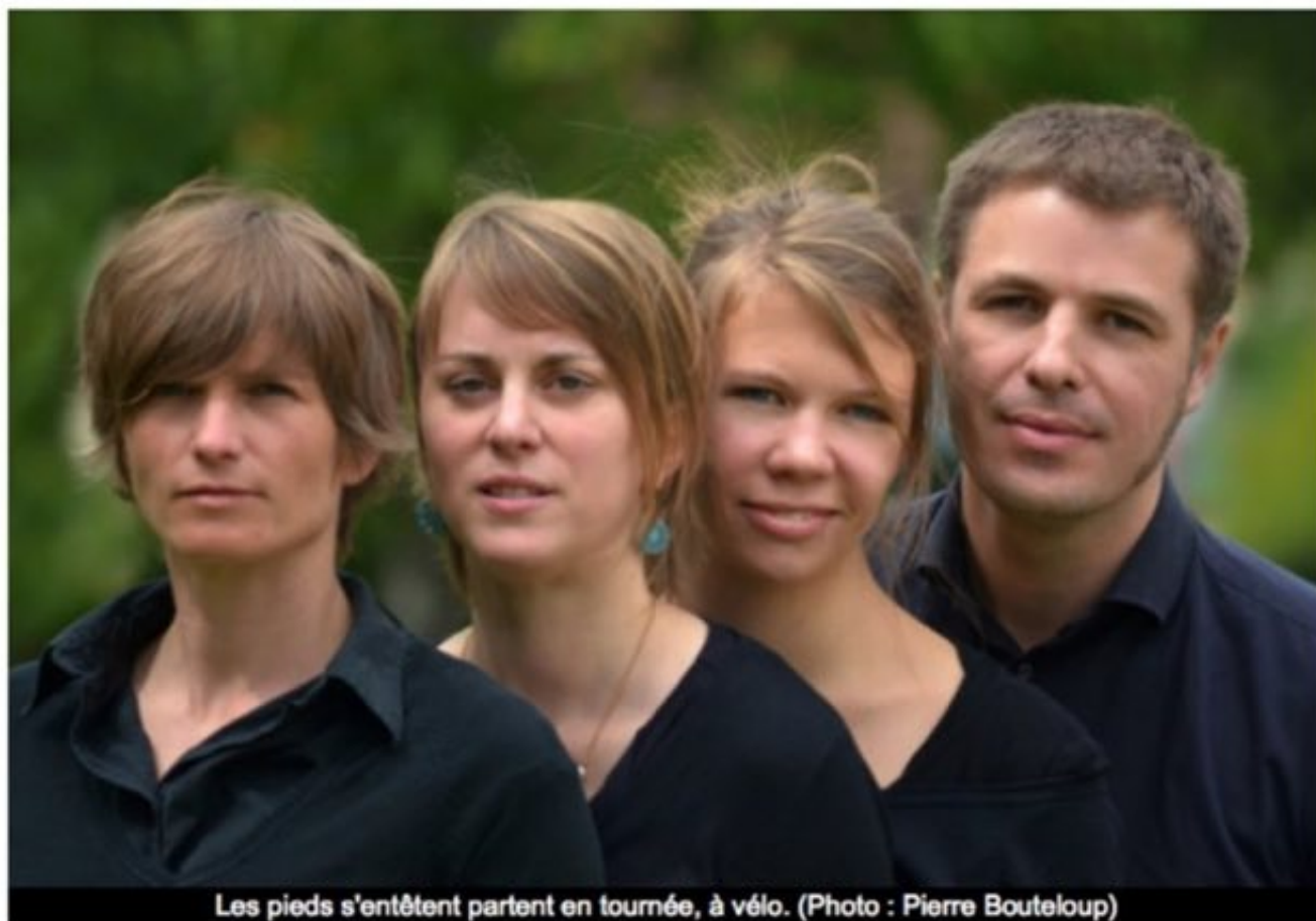
Les pieds s'entêtent partent en tournée, à vélo.

Dernière mise à jour : 12/03/2014 à 17:16